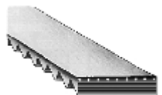
CORREAS DENTADAS BANDO BANCOLLAN TN