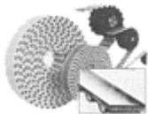
CORREAS SÍNCRONAS DE POLIURETANO Y NEOPRENO ABIERTAS