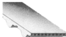
CORREAS DE DISTRIBUCIÓN BANCOLLAN STS SUPER TORQUE