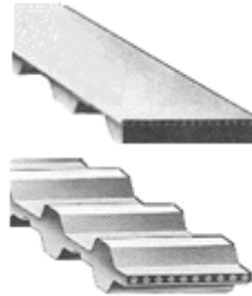
CORREAS DENTADAS BANCOLLAN